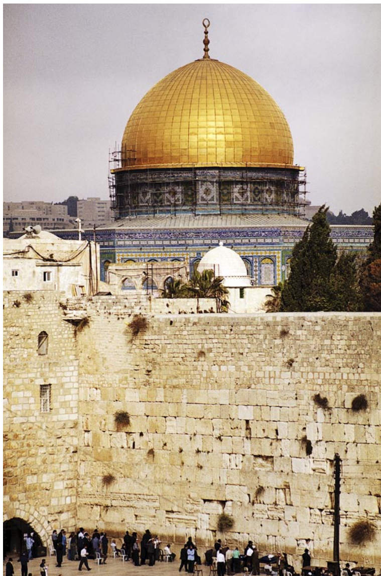
Již dva tisíce let oplakávají Židé zničení Chrámu u Zdi nářků.